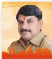
डॉ मोहन यादव जी माननीय मंत्री उच्च शिक्षा