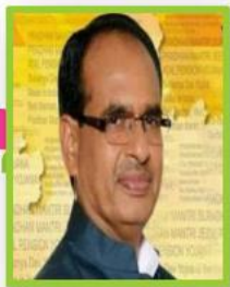
माननीय मुख्य मंत्री श्री शिवराज सिंह चौहान जी