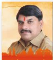
डॉ मोहन यादव जी माननीय मंत्री उच्च शिक्षा